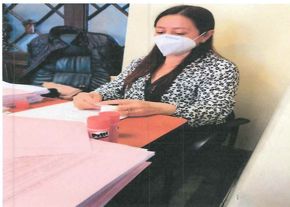
Clasificación de expedientes en Palacio Nacional de la Cultura

Se apoyó en la revisión y análisis de cada uno de los expedientes que ingresaban al Departamento De Apoyo a la Creación Artística, chequeando que fueran debidamente ordenados como lo solicita el Departamento Financiero, separando el convenio original y colocando la copia del mismo, adhiriendo en el recibo 90 quetzales en timbres, haciendo un total de 1605 expedientes conformados, se apoyó solicitando firmas y sellos correspondientes.