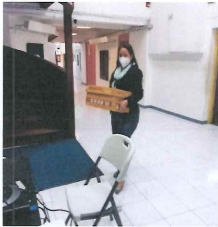
Resguardo de documentos

Se apoyó con el resguardo de cajas de expedientes, se resguardaron los timbres dejándolos en un lugar adecuado y seguro.