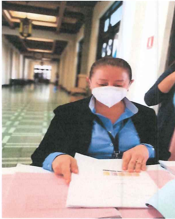
Revisión de expedientes

Se apoyó con la revisión de expedientes previo a ingresarlos al del Despacho superior, se revisó que llevarán timbres, firmas y sellos correspondientes, copia de DPI, se verifico que cada uno de los expedientes fuera debidamente foliado que tuviera sus respectivos convenios, de manera ordenada como se encuentra en los listados.