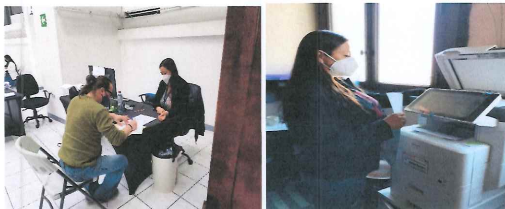
Elaboración de comprobante CCMAA

Se apoyó con la impresión de listados, acuerdo ministerial de los convenios, y del acuerdo Ministerial No. 1078-2021 mismos que más adelante serían utilizados en la conformación de los expedientes.