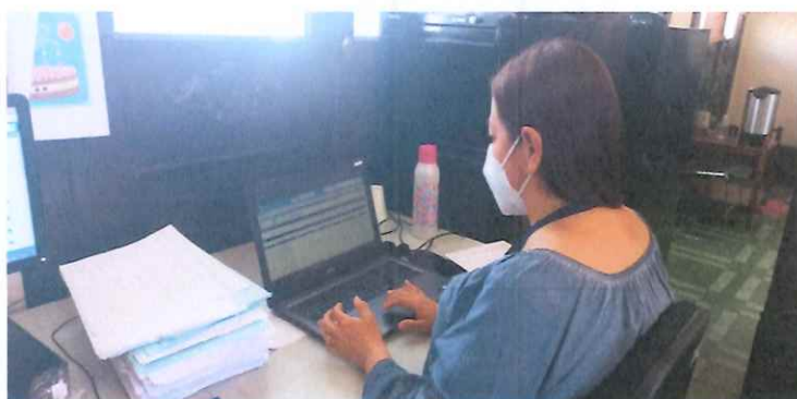
Autorización de documentos Palacio Nacional